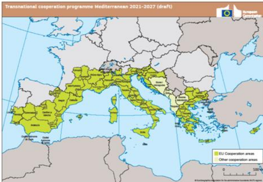
Map 1 : Transnational cooperation programme Mediterranean 2021-2027

Source: Draft Orientation Paper of the European Commission « INTERREG Euro-Mediterranean Area 2021-2027 », 2019