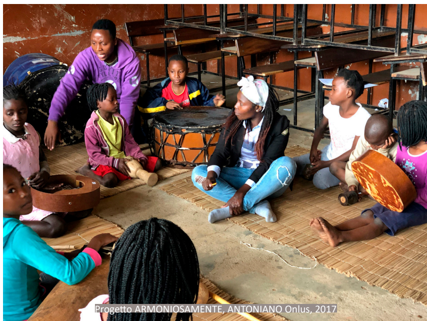
Progetto ARMONIOSAMENTE, ANTONIANO Onlus, 2017

No local (Mozambique) conta com a parceria da Iverca e Associação Vanghano Va Infulene.