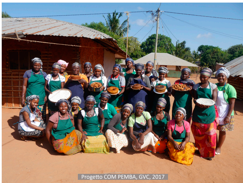
Progetto COM PEMBA, GVC, 2017