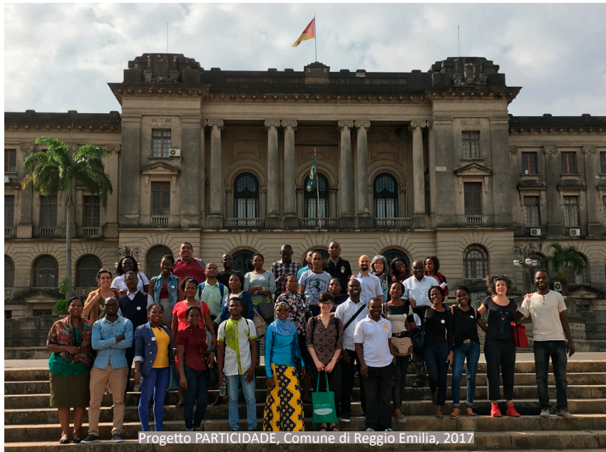
Progetto PARTICIDADE, Comune di Reggio Emilia, 2017

De facto, os municípios devem desempenhar um papel fundamental no desenvolvimento de oportunidades para os jovens, tanto em termos de emprego como de criação de novas empresas. A intenção é entender como podemos incentivar a criação de um sistema baseado no conceito de cooperação, a fim de conectar em rede as ideias e oportunidades de investimento nos territórios de Maputo e Pemba, muitas vezes caracterizados por uma alta demanda por